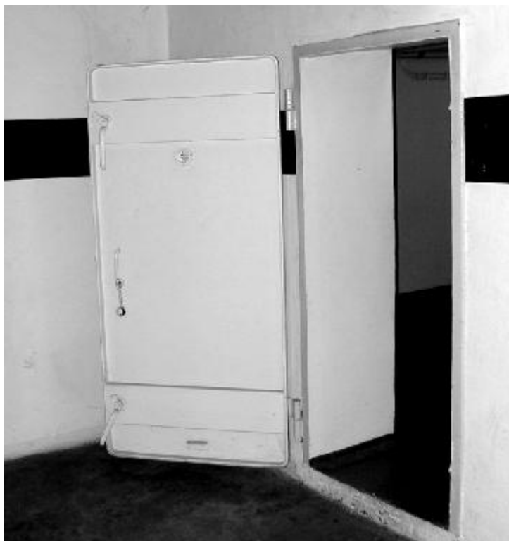
Дверь немецкого бомбоубежища времён Второй мировой войны

выходила из строя или когда наружный воздух был ядовитым. Если бы кто-то захотел ввести внутрь ядовитый газ — например, цианид, — то всё, что ему нужно было сделать, так это слегка переделать металлический воздухопровод с навесной крышкой, так чтобы внутрь можно было забросить корзинку с Циклоном-Б. Затем, когда внутрь поступал воздух (желательно — тёплый), цианид бы выходил из гранул и поступал в бомбоубежище.