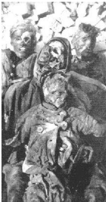
Немецкий холокост. Жертвы союзнических бомбардировок

первыми, кто приступил к методическим бомбардировкам гражданских объектов, были британцы, ещё в мае 1940 года, на что Германия, проявив большую выдержку, ответила той же монетой лишь в сентябре 1940-го. Что касается японской бомбардировки Пирл-Харбора, то она чётко была нацелена исключительно на военные объекты, причём производилась она безо всяких консультаций с женщинами и детьми из Хиросимы, Нагасаки, Токио или какого-либо другого японского города.