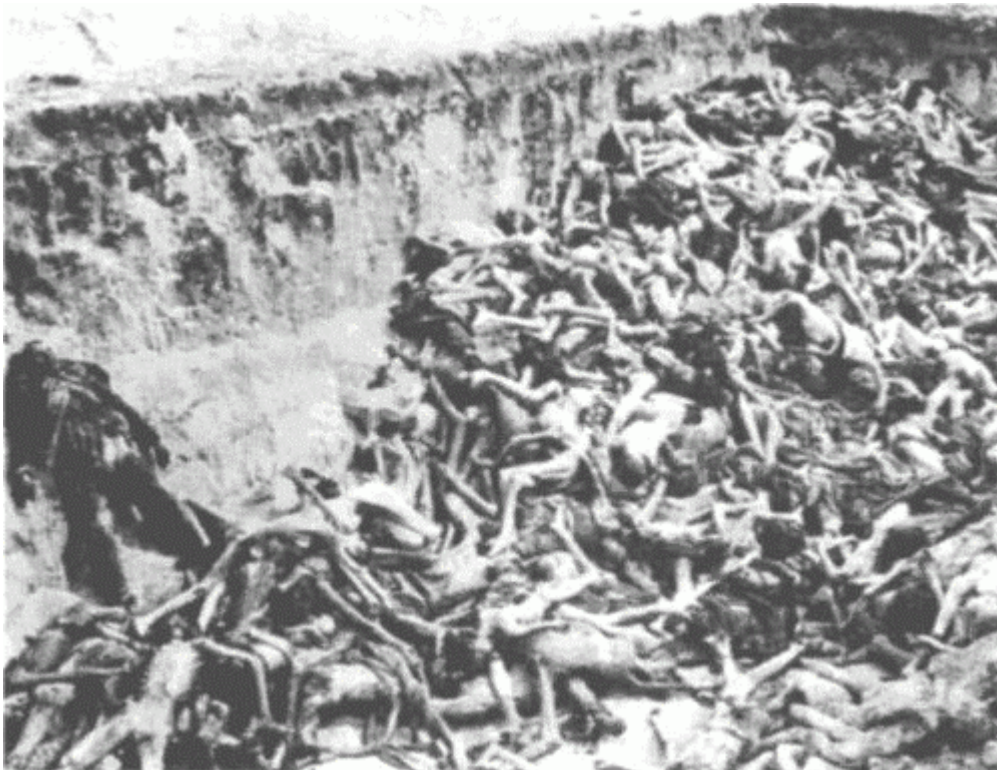
Братская могила умерших от тифа в лагере Берген-Бельзен в конце войны

Я никогда не утверждал, что с помощью дизельного выхлопа или Циклона-Б нельзя осуществить массовые убийства, пусть кто-то и пытался приписать мне эти слова. Название моей главы из книги «Разбор холокоста», на мой взгляд, весьма удачное. На то, чтобы его сформулировать, мне потребовалось каких-то пятнадцать лет. Вот как оно звучит: «Дизельные газовые камеры. Идеальное орудие пытки, нелепое орудие убийства»[10]. Сюда можно добавить «...и невероятное». Я просто не могу поверить в то, что нацисты, во всех других отношениях столь искусные и технически сообразительные специалисты, были настолько глупы, что стали применять дизельный выхлоп хотя бы для того, чтобы просто попробовать кого-то убить.