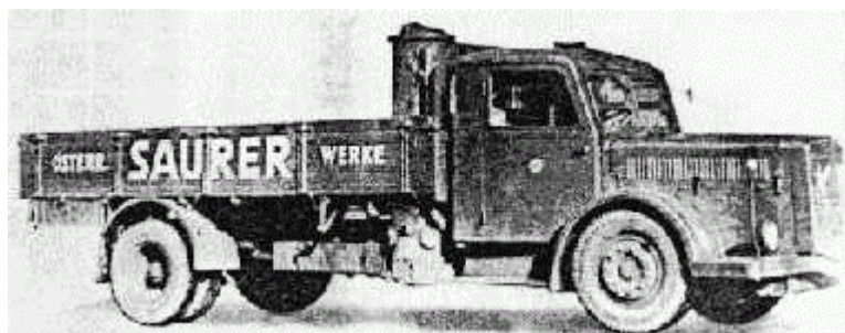
Дизельный грузовик марки Заурер с нетоксичным выхлопом