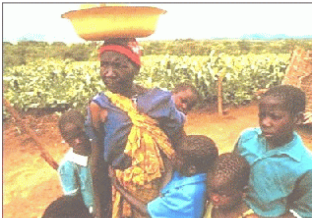
Эта пожилая женщина из Малави должна заботиться о девяти своих внуках и внучках, поскольку их родители умерли от СПИДа. Тем временем, около 10% всех африканских детей — сироты или полусироты, и у многих из них ВИЧ[8].

Жуткие сцены из Берген-Бельзена, Дахау и других немецких лагерей, заснятые в конце Второй мировой войны, ложно и с завидной регулярностью преподносятся как типичные условия содержания в немецких концлагерях времён войны. На самом же деле эти условия вовсе, даже близко не были типичными. Наоборот, они являлись прямым, пусть и непреднамеренным результатом американских и британских бомбардировок немецких гражданских объектов. Подлинными военными преступниками и серийными убийцами были американцы.